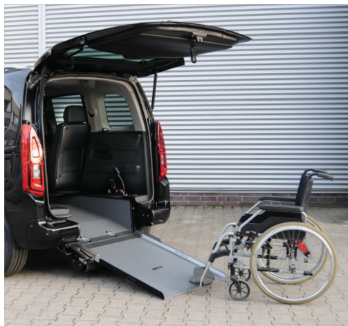
Bei ausgeklappter Rampe lässt sich das Fahrzeug bequem mit dem Rollstuhl befahren.