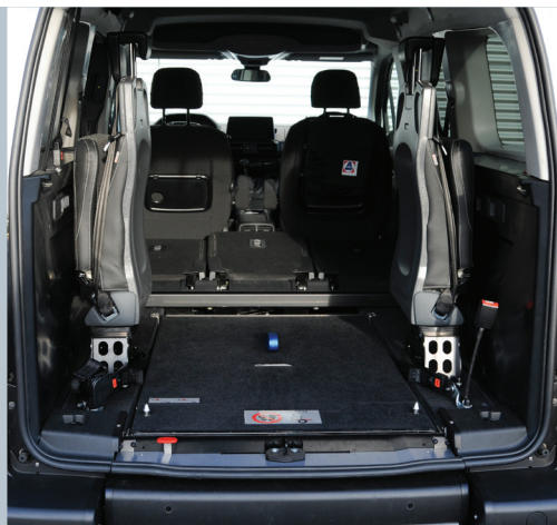
Die eingeklappte EASYFLEX Rampe ermöglicht die volle Nutzung des Kofferraums.