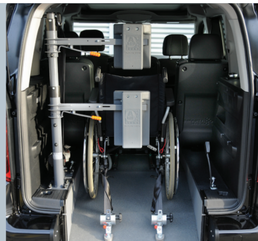
Das Fahrzeug kann mit der Kopf- und Rückenstütze FUTURESAFE ausgestattet werden.